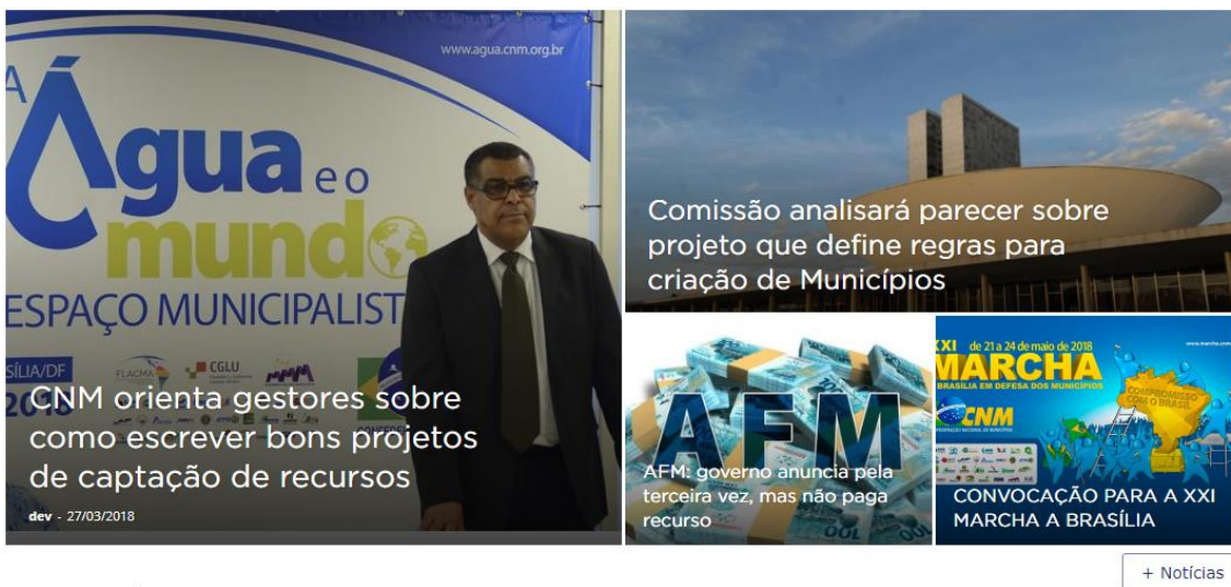
Figura 5 - Módulo de notícias mais recentes

O módulo de notícias é onde ficam disponibilizadas as notícias mais recentes postadas no site. As notícias postadas se referem a atos da gestão do ente ou divulgação de prestação de algum serviço.