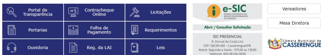
Figura 6 - Acesso rápido