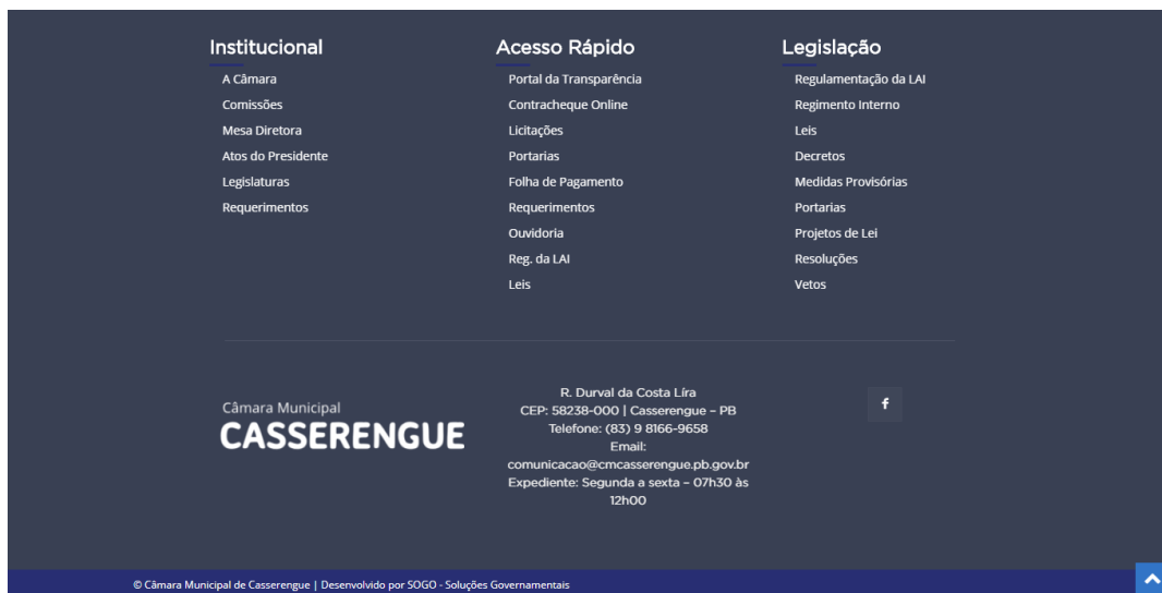
Figura 7 - Rodapé

No rodapé é disponibilizado o mapa do site , com todos os menus, acessos e seus respectivos links. Além disso, no rodapé também é disponibilizado a logomarca do ente, informações de localização e contato.